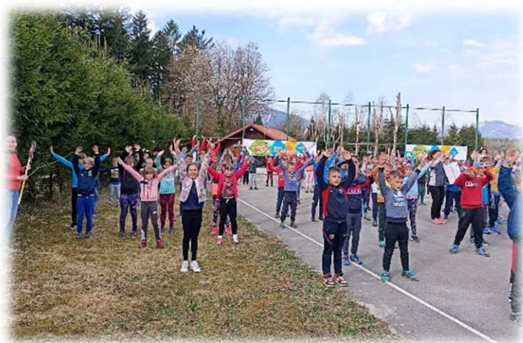
Miniolimpijada na Lazah

V novembru smo obeležili tradicionalni slovenski zajtrk, učenci pa so si ogledali tudi video gradivo na to tematiko. Z različnimi nasveti za zdravo spanje smo 18. 3. obeležili svetovni dan spanja, ob Dnevu Zemlje, 22. aprila pa smo se s prispevkom spomnili tudi na naš planet. Učenci druge in tretje triade so 23. marca sodelovali na spletno interaktivni predstavi Zavajanje in laži na internetu, ki jo je izvedla ekipa Safe.si.