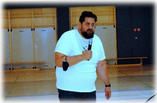
Uvod v Bralno značko