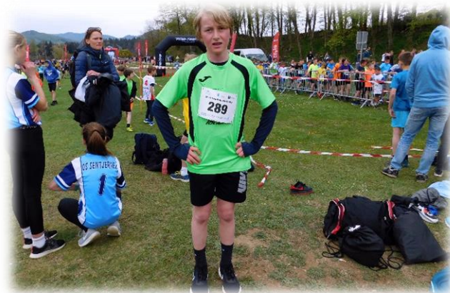
Gal na krosu