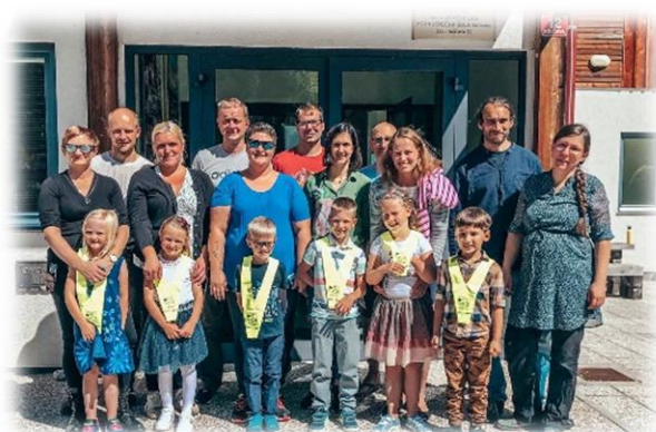
Prvi šolski dan v Lučah in Solčavi