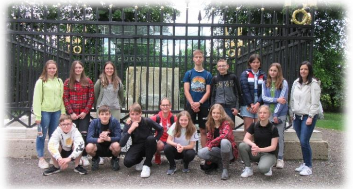
Izlet v Minimundus

Knjigo smo pri pouku nemščine tudi z različnimi vajami analizirali, nato pa so učenci v mesecu marcu reševali spletni preizkus znanja. Tekmovanje je organiziral Center Oxford pri založbi Mladinska knjiga.