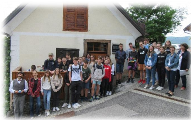
Obisk Cankarjeve domačije