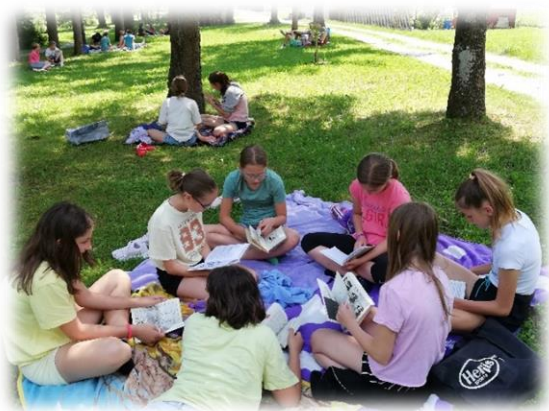
Zaključek Bralne značke