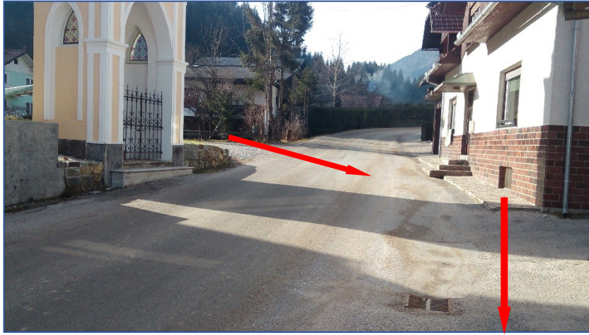
Križišče na Farovškem logu

Prečkanje ceste – učenci, ki pridejo iz Farovškega loga (prečkajo pri kapelici – ni prehoda, proti šoli gredo ob cesti, kjer ni pločnika).