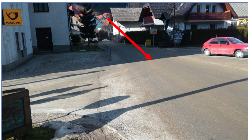
Križišče pri gasilskem domu

Odhod kombijev pred šolo; večina odpelje istočasno, učenci za Podvolovljek in Solčavo stojijo pred vhodom šole.