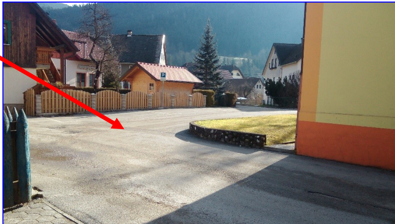
Pred šolskim vhodom

Odhod kombijev pred šolo; večina odpelje istočasno, učenci za Podvolovljek in Solčavo stojijo pred vhodom šole.